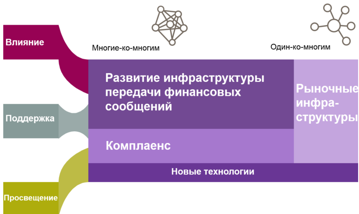
Рис.5 Направления развития РОССВИФТ до 2020г.

Поскольку российское сообщество пользователей существует на протяжении более 20 лет, и фаза активного роста количества пользователей пройдена, модель потребления услуг теряет свою актуальность. Появляется возможность влияния на развитие SWIFT в направлениях, представляющих интерес для российского сообщества пользователей, в том числе через участие в Совете директоров SWIFT – “from consumption to contribution”.