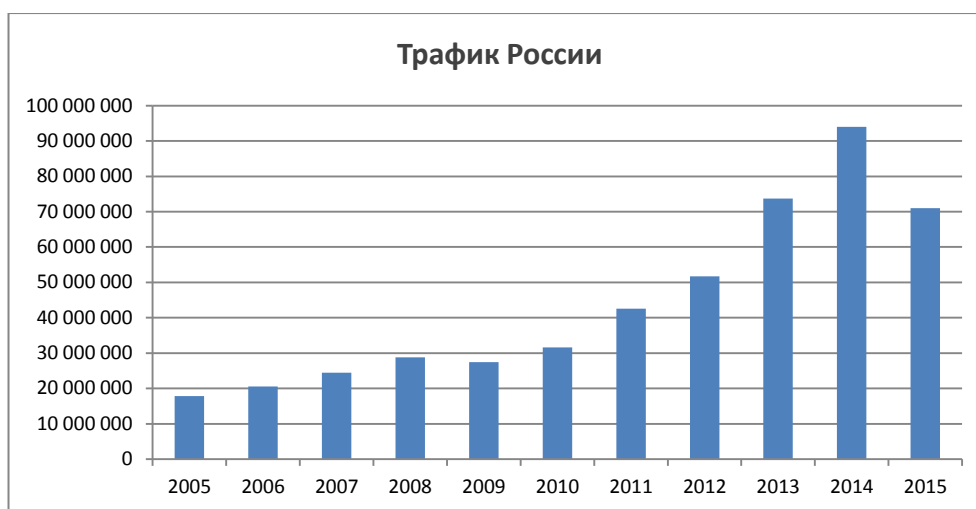
Рис. 3. Трафик пользователей SWIFT в России

Финансовая индустрия меняется в ответ на появление новых технологий, особенности регулирования, развитие бизнес-процессов и ожидания участников.