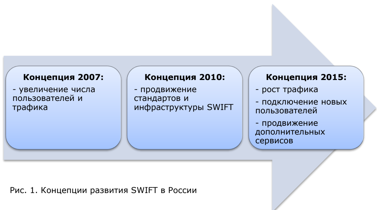
Рис. 1. Концепции развития SWIFT в России

В концепции 2015 года основными целями стали локализация, содействие в создании МФЦ , а также вхождение представителя от России в Совет Директоров SWIFT .