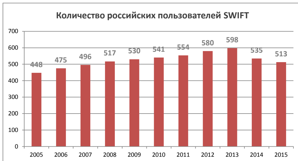
Рис. 2. Количество российских пользователей SWIFT